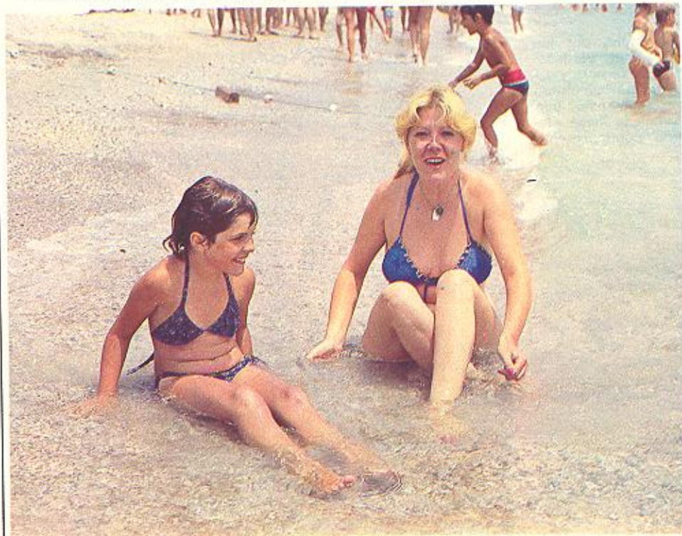
Tía y sobrina jugaron al borde de la playa