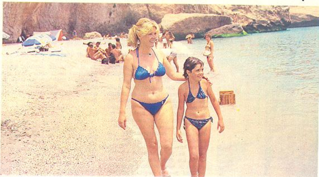
Un penúltimo paseo de sobrina y tía por la deliciosa playa

«Me haría mucha ilusión poder comprarme una casa aquí»